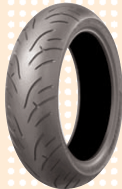
Der neue Bridgestone BT-023 Sport-Touring ersetzt den BT-021

Für heuer erwartet die Branche eine gleichbleibende Entwicklung wie 2009. Die Hersteller set-